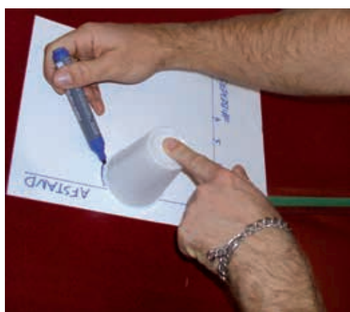
Waar de beker stopt, zet je een streep