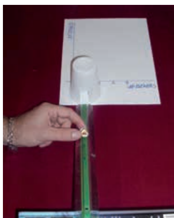
De meetopstelling is eenvoudig

Leerlingen hebben vaak moeite om bij practica rekening te houden met meetonzekerheid. Zij zien niet in waarom een proef herhaald moet worden en waarom dit een betrouwbaarder resultaat geeft. Met deze eenvoudige meting kun je ze dit laten zien.